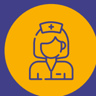
Técnico(a) de enfermagem